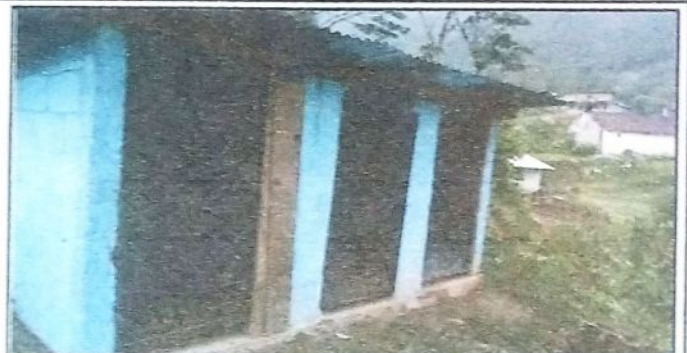
Foto 2: Con el Apoyo de Padres de familia se muestra el avance de la habilitación del baño