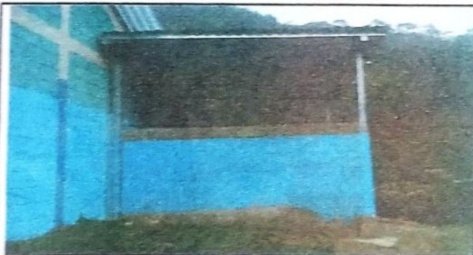
Foto 3: el avance de aplicación pintura para un trabajo seguro y estable