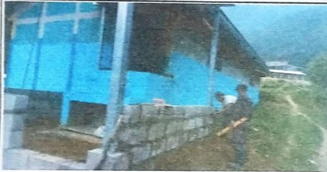
Foto1: Se evidencia el proceso de sustitución del soporte de la estructura del techo del tinaco