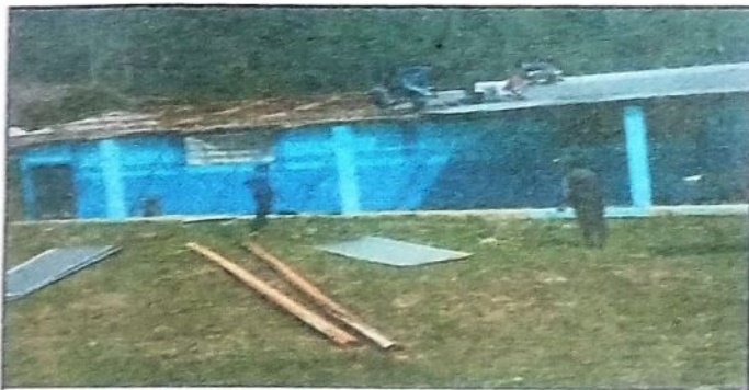
Foto 5: Con el apoyo de Padres de Familia la desinstalación de soporte de madera por metal