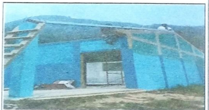
Foto 4: se identifica el avance de colocación de columnas de fundición de concreto y la colocación de costaneras