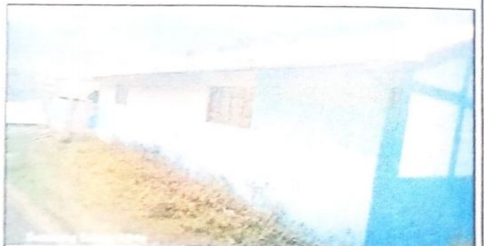
Foto 6: como se muestra en la fotografía la instalación de canales y bajadas de aguas de forma formal

Observación: Si es necesario se pueden agregar hojas adicionales y actualizar el número de hojas.